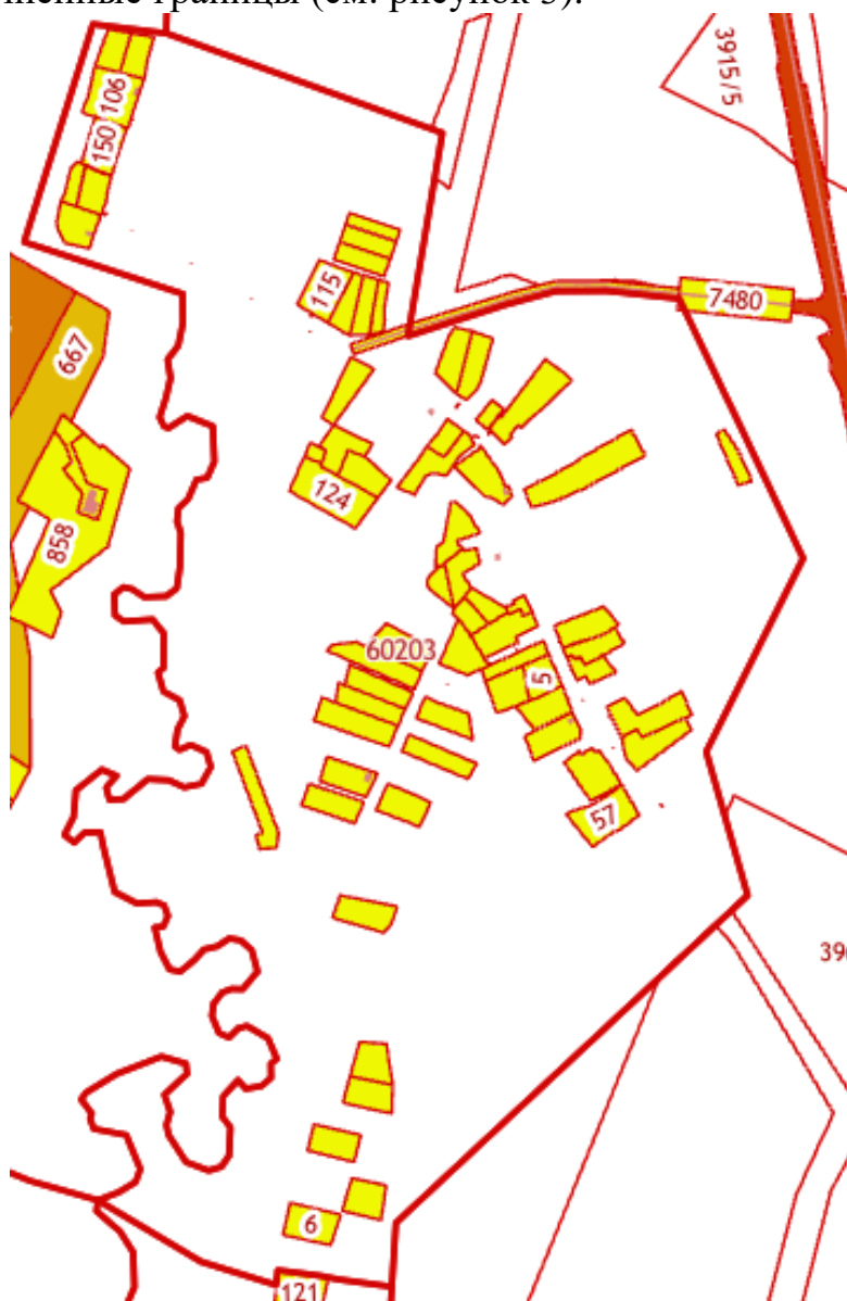
Рисунке 3. Схема расположения территории исследования на Публичной кадастровой карте

На момент разработки проекта межевания на исследуемой территории существуют 91 земельных участка, из них в соответствии с данными Филиала публично-правовой компании «Роскадастр» по Иркутской области 65 земельных участка, имеют уточнённые границы (см. рисунок 3).